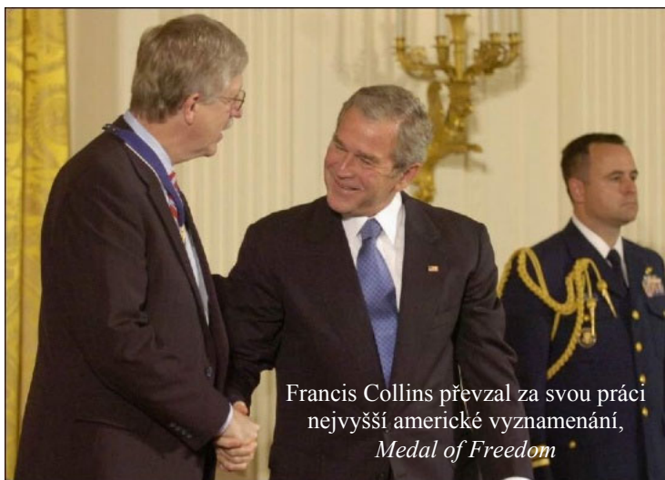
Francis Collins převzal za svou práci nejvyšší americké vyznamenání, Medal of Freedom

Ti, kdo hájí doslovnou četbu Geneze (svět stvořený před nějakým tím tisíciletím v šesti dnech tak jak je) nesmírně škodí víře. „Mladí, kteří vyrůstali v rodinách a kostelích, kde se naléhalo na tuto formu kreacionismu – napsal vědec Francis Collins, ředitel projektu, jenž vedl k objevu lidského genomu a upřímný věřící – dříve nebo později objeví zdrcující vědeckou evidenci ve prospěch vesmíru značně staršího a vzájemný vztah všech živých tvorů v procesu vývoje a přirozeného výběru. Před jak hroznou a zbytečnou volbou tak stojí! ... Není proto divu, že mnozí z těchto mladých se od víry odvrátí s konstatováním, že nemohou věřit v Boha, který po nich žádá, aby zavrhli to, čemu je s takovou zřejmostí stran vesmíru učí věda“ 6 .