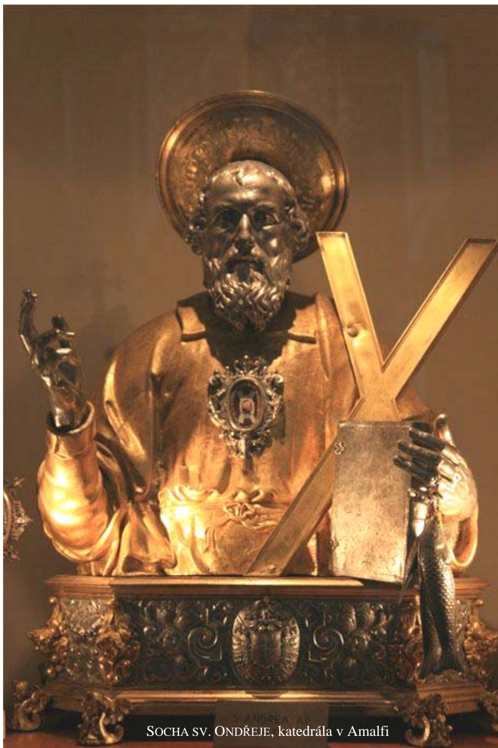
SOCHA SV. ONDŘEJE, katedrála v Amalfi

V seznamech Dvanácti zaujímá Ondřej druhé místo, jako u Matouše (10,1-4) a Lukáše (6,13-16), nebo čtvrté místo jako u Marka