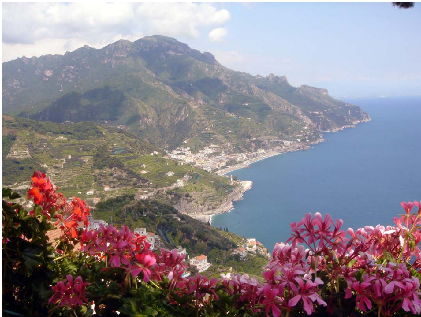
Amalfské pobřeží - pohled z Ravella

(Beniamino Depalma, arcibiskup Amalfi-Cava de'Tirreni)