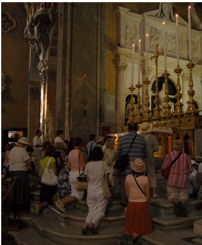
Pustiměřští poutníci u relikviáře sv. Kateřiny Sienské v římské bazilice Santa Maria sopra Minerva, Peregrinatio ad Limina Apostolorum , 11. 6. 2007.

Drazí bratři a sestry, naučme se od svaté Kateřiny milovat odvážně a upřímně Krista a církev. Přijměme tedy za svoje slova svaté Kateřiny, která čteme v Dialogu s Božskou prozřetelností v závěru kapitoly, která pojednává o Kristu – mostu: „Z milosrdenství jsi náš obmyl Krví, z milosrdenství jsi chtěl rozmlouvat s tvory. Ó, šílená lásko! Nestačilo ti se vtělit, nýbrž chtěl jsi také zemřít! Ó milosrdenství! Srdce mi tone v myšlení na Tebe, takže kamkoli se v myšlenkách obrátím, nenalézám nic než milosrdenství“ (kap. 30, str. 79-80).