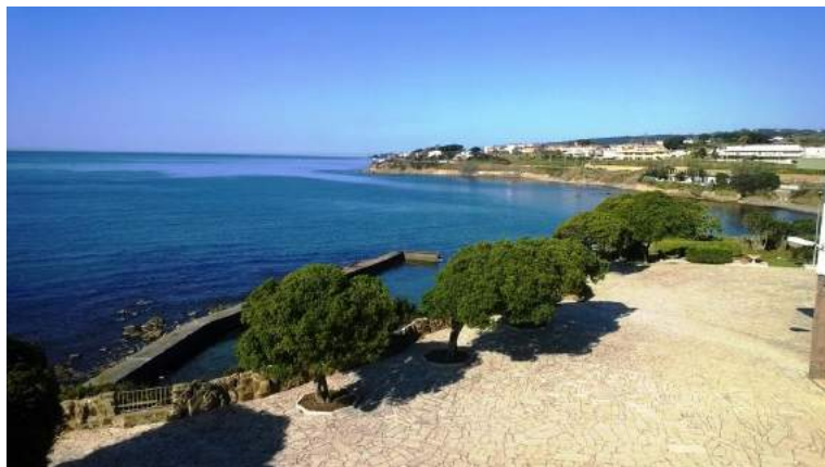
BOLSENA - koupání v jednom z největších vulkanických jezer Evropy, nocleh s polopenzí.