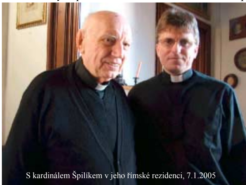
S kardinálem Špidlíkem v jeho římské rezidenci, 7.1.2005

Eminence, dovolte mi, vyjádřit Vám v těchto dnech upřímný pozdrav a hlubokou úctu. Vždyť kolikrát Prozřetelnost vložila Vám už do rukou, byste její řádky psal: před pontifikátem "přítele" Jana Pavla II. svěřila Vám prorocství, jeden z Vašich výroků dokonce "neomylností" se skví! Modlíme se za Vás, by kaple Sixtínská dala v slovech vašich proroků dávných slyšet hlas,