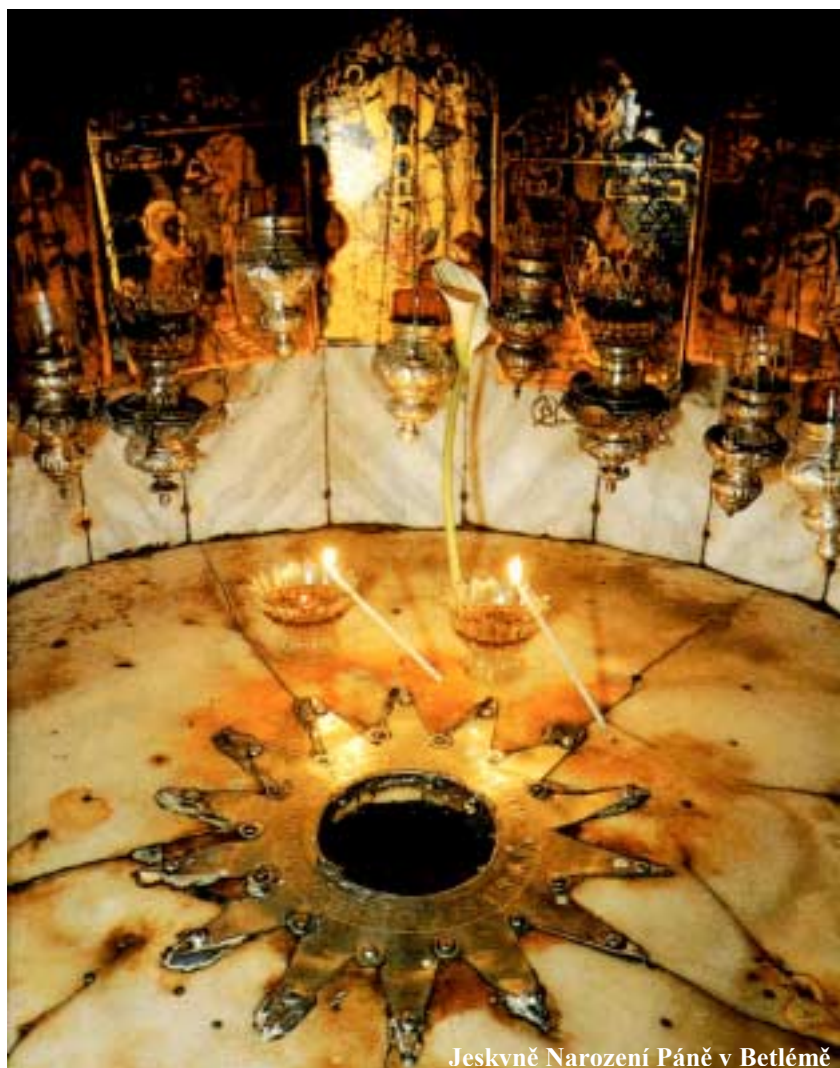
Jeskvně Narození Páně v Betlémě

Opakujeme však se svatým Pavlem, žádné společenství mezi světlem a temnotami, žádný vztah mezi Kristem a Beliálem (srv. 2Kor 6,14 ), mezi Kristem a modlami. Jedině On je světlem světa. Při jeho narození se andělé zjevili pastýřům a „sláva Páně – totiž šekinah , Boží záře – je zahalila světlem“ ( Lk 2,9 ). Hvězda přivedla zdáli Mágy a ukázala jim Mesiáše. Světlo je darem Dítěte Ježíše: darem radostným, duchovním, vnitřním, který mocně zasahuje všeobecnou představivost, takže jesličky, vánoční stromy, okna domů, cesty, obchody na celém světě jsou zaplaveny světlem. Je to však světlo křehké, které může být zastíněno, odmítnuto, uhašeno: „sv. Jan to jasně říká v Prologu: „Světlo svítí v temnotách, a temnota ho nepostihla“ ( Jan 1,5 ). I Ježíšovo