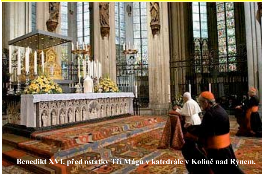
Benedikt XVI. před ostatky Tří Mágů v katedrále v Kolíně nad Rýnem.

Budou se ti, Hospodine klanět všechny národy.