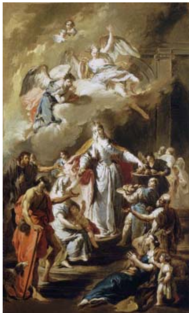
Giambattista Pittoni, sv. Alžběta Uherská rozdává almužny, Muzeum krásných umění, Budapešť, 1734

Často se umrtvovala, když uprostřed noci vstávala, aby se po straně postele modlila. Když se Ludwig natáhl, nahmatal její chladné dlaně, sepnuté na přikrývce. Schoulil je do těch svých a šeptal jí: „Pošetří se, sestřičko“.