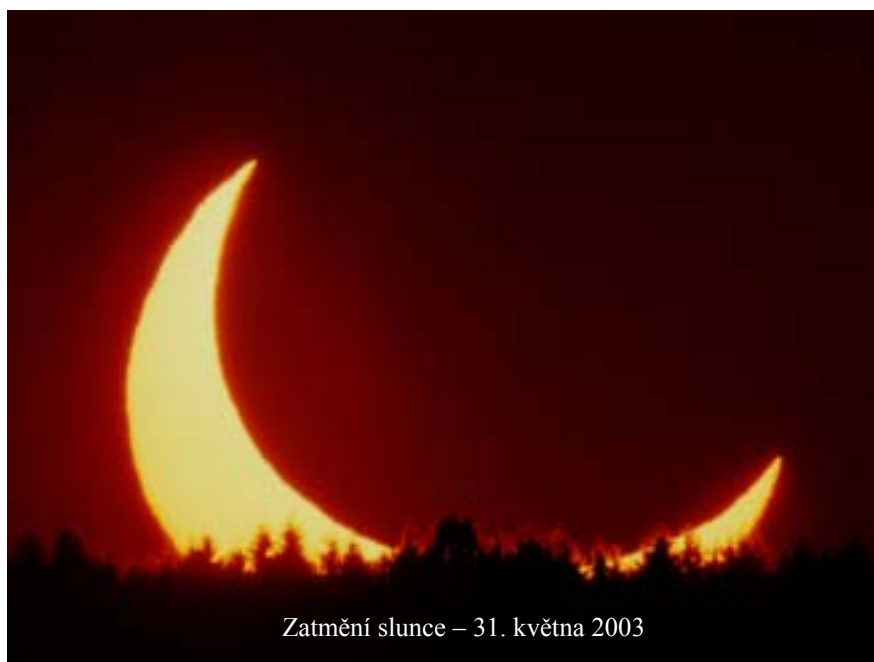
Zatmění slunce – 31. května 2003

„V těch dnech, po velkém soužení, se zatmí slunce a měsíc přestane svítit, hvězdy budou padat z nebe a hvězdný svět se zachvěje. A tehdy (lidé) uvidí Syna člověka přicházet v oblacích s velikou mocí a slávou. Potom pošle anděly a shromáždí své vyvolené ze čtyř světových stran, od konce země až po konec nebe. Poučte se z přirovnání o fíkovníku! Když se už jeho větve nalévají mízou a nasazují listy,