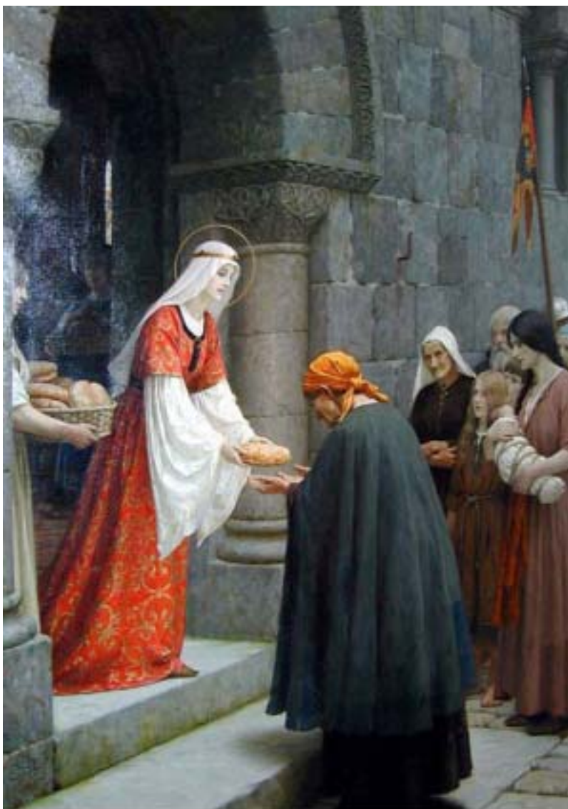
E. Blair, Štedrost sv. Alžběty Uherské

Krutá zima konečně polevila. Ale přišla epidemie neštovic. Na ulicích leželi mrtví. Alžběta brala své děti do soukromé kaple a tam se modlili: „Pane Bože, svěřuji Ti sebe samu, své děti i celou moji rodinu. Drž nade mnou svou ochranou ruku, když konám tvou vůli a dej mi sílu, abych to dokázala“ . Pak vyšla, aby pečovala o nemocné a pohřbívala mrtvé. Ve venkovských oblastech jí pomáhaly ženy a jejich služebnictvo, takže Alžběta mohla postavit malou nemocnici u cesty v podhradí. V Německu šlo o první