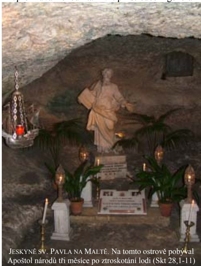
JESKYNĚ SV. PAVLA NA MALTĚ. Na tomto ostrově pobýval Apoštol národů tři měsíce po ztroskotání lodi (Skt 28,1-11)

/promluva Benedikta XVI. při střeďeční generální audienci, 15. listopadu 2006 na náměstí sv. Petra/