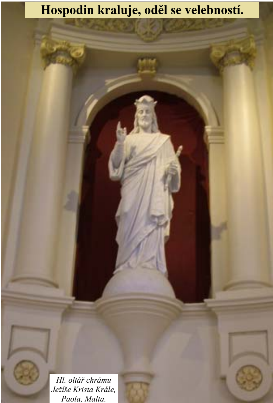
Hl. oltář chrámu Ježíše Krista Krále, Paola, Malta.