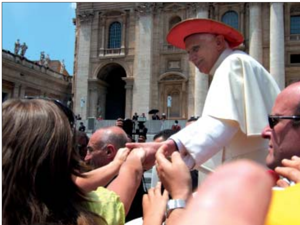
Stisk rukou s papežem Benediktem XVI. při středeční generální audienci na náměstí sv. Petra