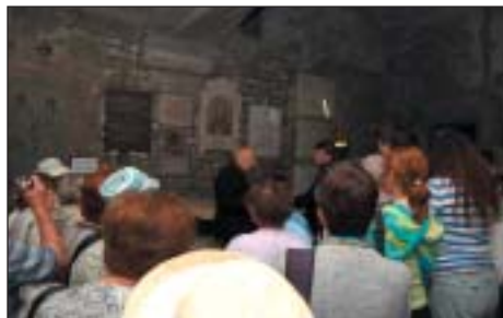
J. E. Tomáš kardinál Špidlík, S.J., čestný občan Pustiměře: při eucharistii v bazilice sv. Klementa (vlevo) a u hrobu sv. Cyrila