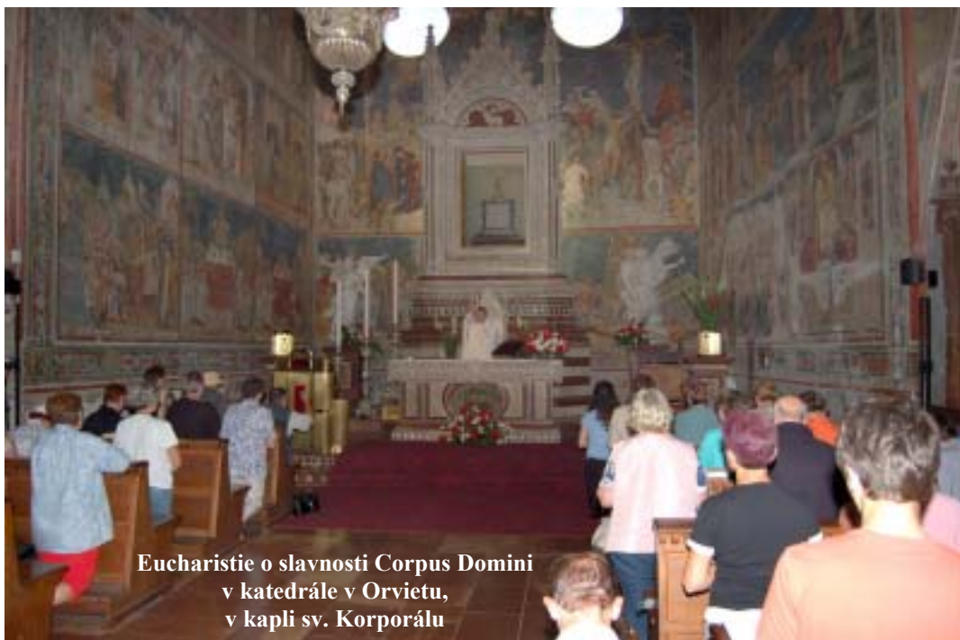
Eucharistie o slavnosti Corpus Domini v katedrále v Orvietu, v kapli sv. Korporálu

"Tento kalich je nová smlouva, potvrzená mou krví. Kdykoli z něho budete pít, číňte to na mou památku." Kdykoli totiž jíte tento chléb a pijete z tohoto kalicha, zvěstujete smrt Páně, dokud on nepřijde.“ (1Kor 11,23-26)