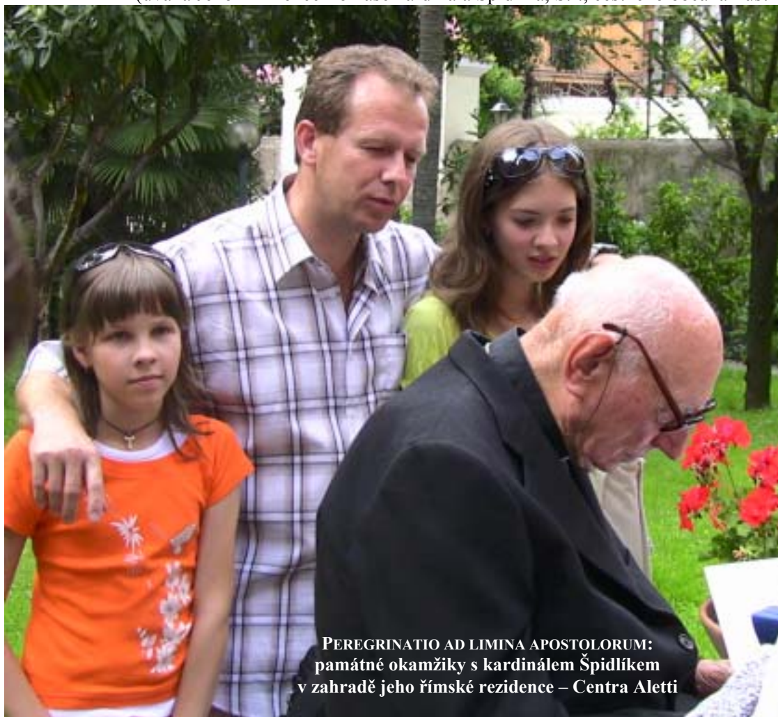
PEREGRINATIO AD LIMINA APOSTOLORUM: památné okamžiky s kardinálem Špidlíkem v zahradě jeho římské rezidence – Centra Aletti

(úvaha Jeho Eminence Tomáše kardinála Špidlíka, S.I., čestného občana Pustiměře)