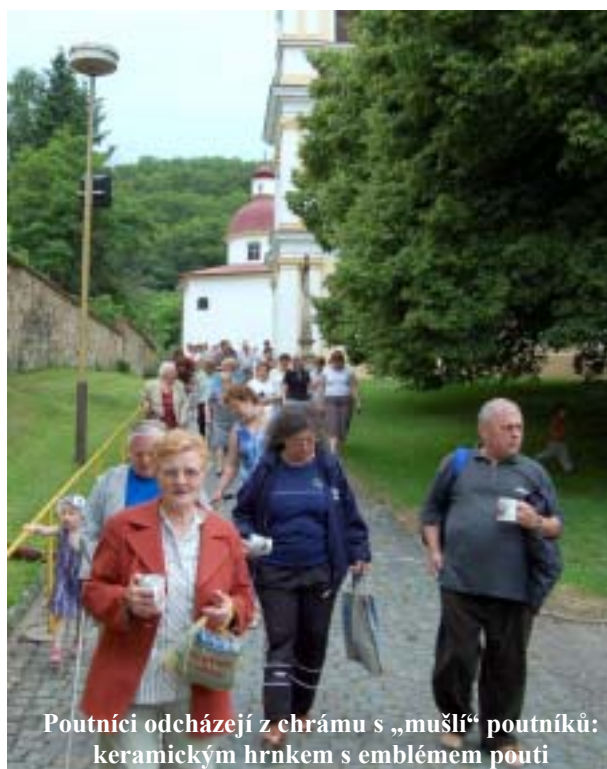
Poutníci odcházejí z chrámu s „mušlí“ poutníků: keramickým hrnkem s emblémem poutí

(z homílie při eucharistii v chrámu sv. Benedikta v Pustiměři, 6. 6. 2007)