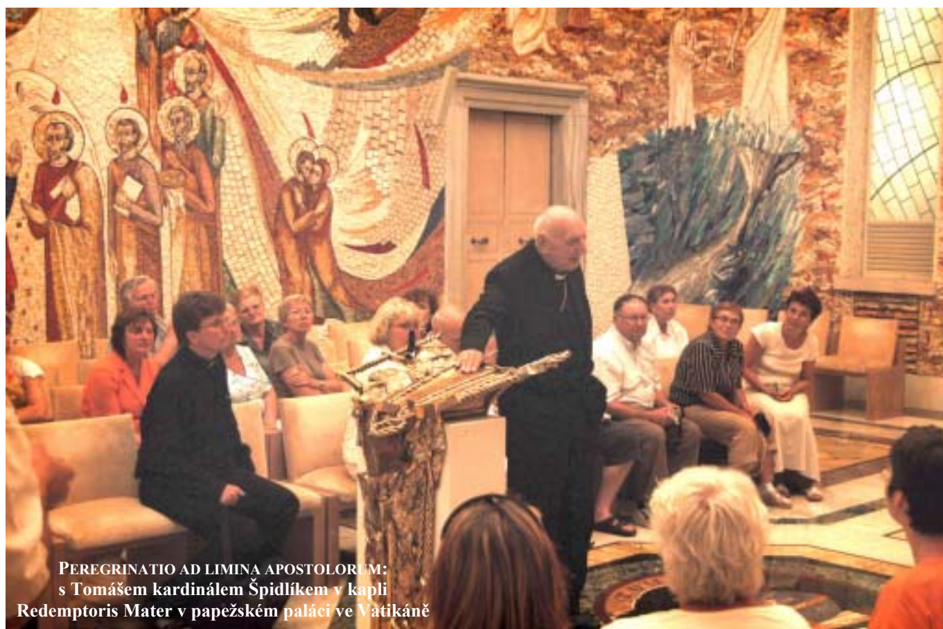
PEREGRINATIO AD LIMINA APOSTOLORUM: s Tomášem kardinálem Špidlíkem v kapli Redemptoris Mater v papežském paláci ve Vatikáně