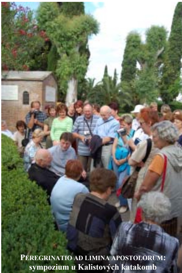
PEREGRINATIO AD LIMINA APOSTOLORUM: symposium u Kalistových katakomb