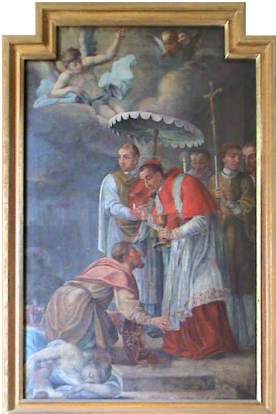
SV. KAREL BOROMEJSKÝ, obraz v chrámu sv. Benedikta v Pustiměři

Budu velebit tvé jméno, můj Bože, Králi.