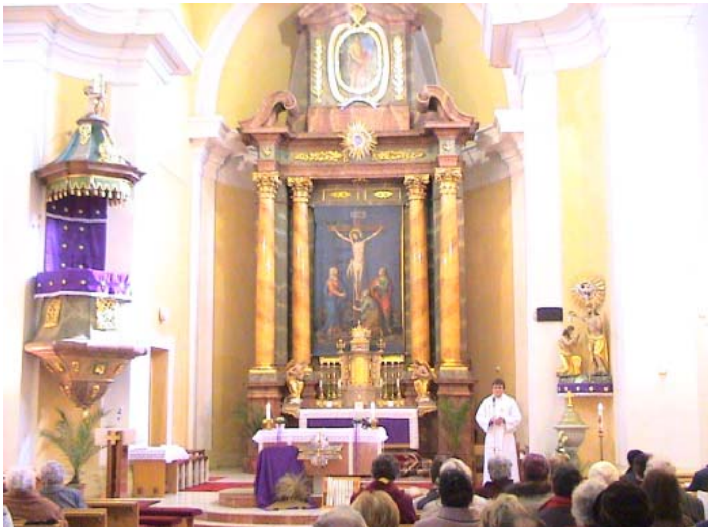
PEREGRINATIO AD FONTES FIDEI, státióve farním kostele sv. Martina v Bánově, 18. března 2007

Až procitnu, Hospodine, nasytím se pohledem na tebe.