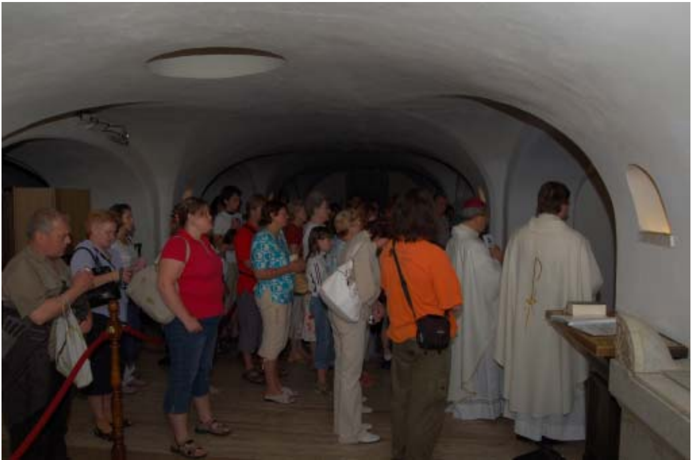
PEREGRINATIO AD LIMINA APOSTOLORUM, modlitba u hrobu Božího služebníka papeže Jana Pavla II. v kryptách vatikánské baziliky, 9. června 2007

Ó Nejsvětější Trojice, děkujeme ti, žes církvi darovala papeže Jana Pavla II. a dala v něm zazářit něžnosti svého otcovství, slávy Kristova kříže a jasu Ducha lásky. Svou bezmeznou důvěrou v tvé nekonečné milosrdenství a v mateřskou přímluvu Panny Marie nám zosobnil obraz Ježíše, Dobrého Pastýře a ukázal nám tak svatost jako vysoké měřítko řádného křesťanského života, jako cestu k dosažení věčného společenství s tebou. Na jeho přímluvu nám podle své vůle uděl milost .....(vložit vlastní prosbu za uzdravení duše či těla), o kterou vroucně prosíme, v naději, že bude brzy přiřazen k počtu tvých svatých. Amen.