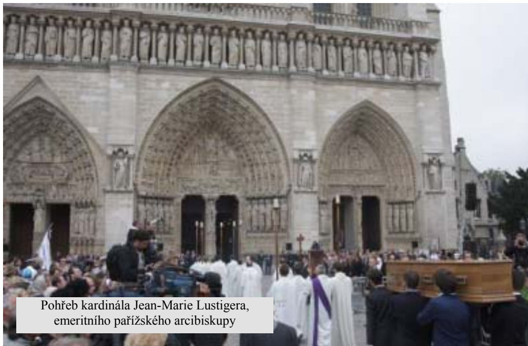
Pohřeb kardinála Jean-Marie Lustigera, emeritního pařížského arcibiskupy

(homílie Benedikta XVI. při zádušní mši svaté ve vatikánské bazilice, 5. listopadu 2007)