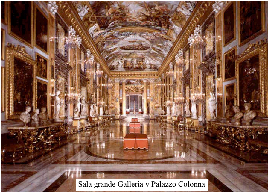
Sala grande Galleria v Palazzo Colonna

„mohutný výbuch“ onoho prvého ve XX. století, jejich koexistence, i podle obrazu jaký nám předkládá podobenství o koukolu a pšenici. Především však zdůrazňuje překonání zla dobrem. Jako ve velkolepém „divadle“ (slovo, které se hned dvakrát vyskytuje už na úvodních stránkách), se tu odvíjí nejen děj uplynulého století, nýbrž celého lidstva. Jsou to dějiny, které mají „šťastný