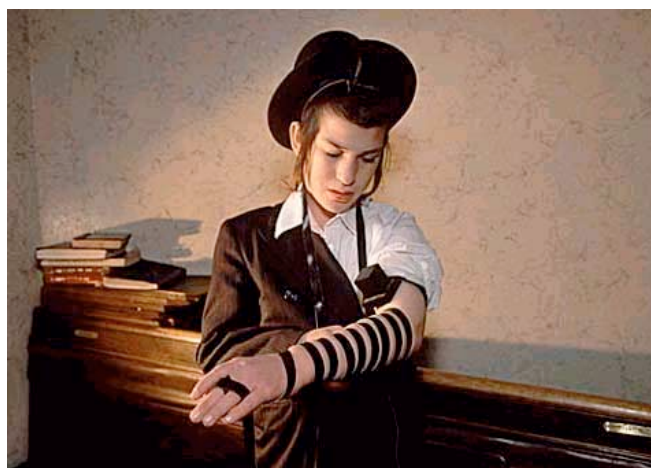
Hasidský chlapec si připevňuje „tefillin“ před ranní modlitbou. „Tefillin“ jsou dvě černé kožené schránky, obsahující úryvky z Pisma psané na pergamenu. Upevňují se na ruku pomocí kožených řemínků. Tradiční židé, včetně hasidim, si připevňují „tefillin“ po čas modlitby počínaje bar mitzvah (13. rokem věku).

Především je třeba uvést, že žalmy patří do různých dob. Jejich kompozice sahá od dob krále Davida a monarchie až po exil a dobu Makabejských (II. století před Kristem). Navíc pocházejí z rozmanitých náboženských prostředí: lze proto očekávat, že jejich náboženský a teologický pohled se nejen postupem času vyvíjel, ale byl rovněž podroben vlivu různých prostředí – královského dvora, kněžského a kultovního