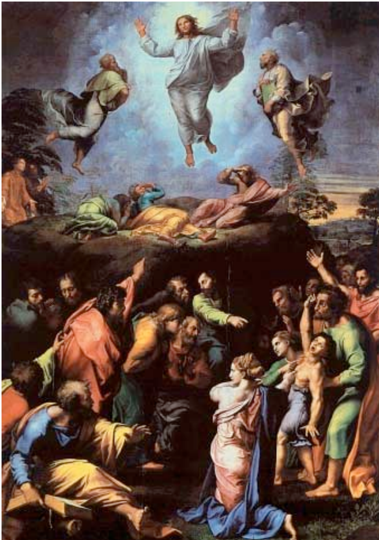
Raffaello, Proměnění Páně, Pinacoteca Vaticana, Città del Vaticano

Vzpomínám si na jednu cestu v Rumunsku. Jeli jsme z rána autem venkovskou silnicí. Předpokládali jsme, že bude volná. Ale na každém kroku jsme museli předjíždět ozdobené vozy s vystrojenými lidmi na nich. Na počátku jsme mysleli, že jde o selskou svatbu. Ale bylo těch svatebčanů příliš mnoho. Nakonec se nám dostalo vysvětlení. Bylo to 6. srpna, svátek proměnění Páně na hoře Tábor. Ten se tu slaví jako svátek klášterů. Vozy skutečně směřovaly k velkému klášteru, kde pak, jak jsme viděli, byla slavnostní bohoslužba na nádvoří s velkou účastí lidu. Byli jsme pak pozváni na oběd, který připravily řeholnice. Byly smažené ryby. Ale i ty byly privilegiem. Svátek spadá do postního období před Nanebevzetím Panny Marie, nesmějí se jíst ani ryby. Svátek Proměnění Páně je však tak velký, že je tu v poledne dispens od postu. U nás svátek 6. srpna mine bez