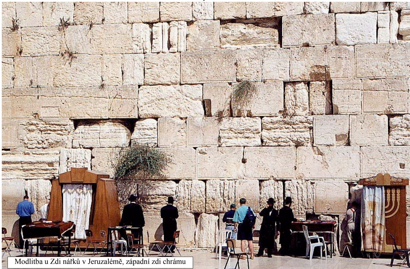
Modlitba u Zdi nářků v Jeruzalémě, západní zdi chrámu

/Š'ma Yisrael Adonai Elohaynu Adonai Echad, Deut. 6,4/