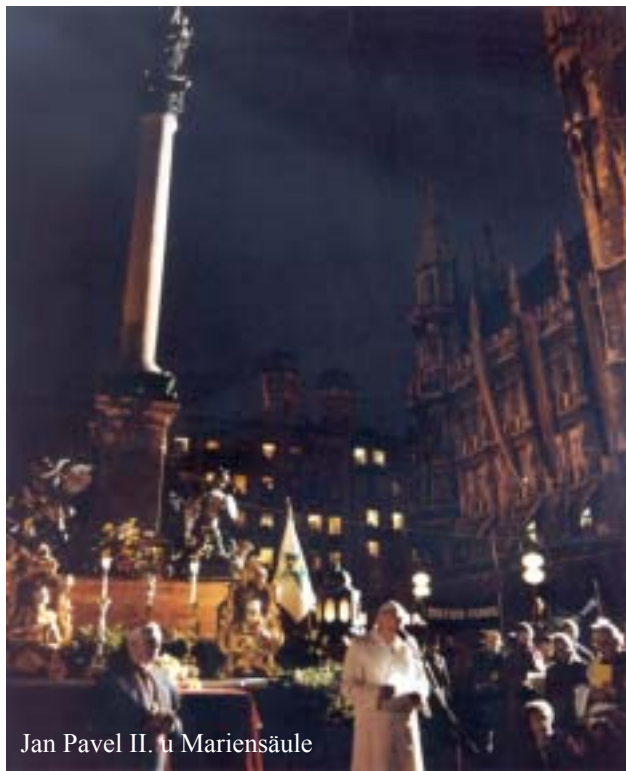
Jan Pavel II. u Mariensäule

sloupu. Od poslední modlitby s Janem Pavlem II. se doby pochopitelně změnila: Tehdejší návštěva papeže Wojtyły v roce 1980 se odehrála uprostřed studené války, kdy se pozvolna tušily i první změny v Polsku. Polský papež kladl důraz na nezbytnost mírové proměny celé Evropy s novým vztahem mezi blízkými národy, jako jsou Německo a Polsko, ale i překonání rozdělení celého kontinentu, k němuž došlo v důsledku poválečného dělení. Když se tehdy – 19. listopadu 1980 - Jan Pavel II. loučil s Mnichovem, řekl: „ Musíme učinit vše, co je v našich silách, abychom položili nový základ a dali novou formu životu a solidaritě lidí a národů tohoto kontinentu, a tak překonat zdrcující důsledky našeho století. Mučedníci a svatí všech dob, až po blahoslaveného Maxmiliána Kolbe, nám